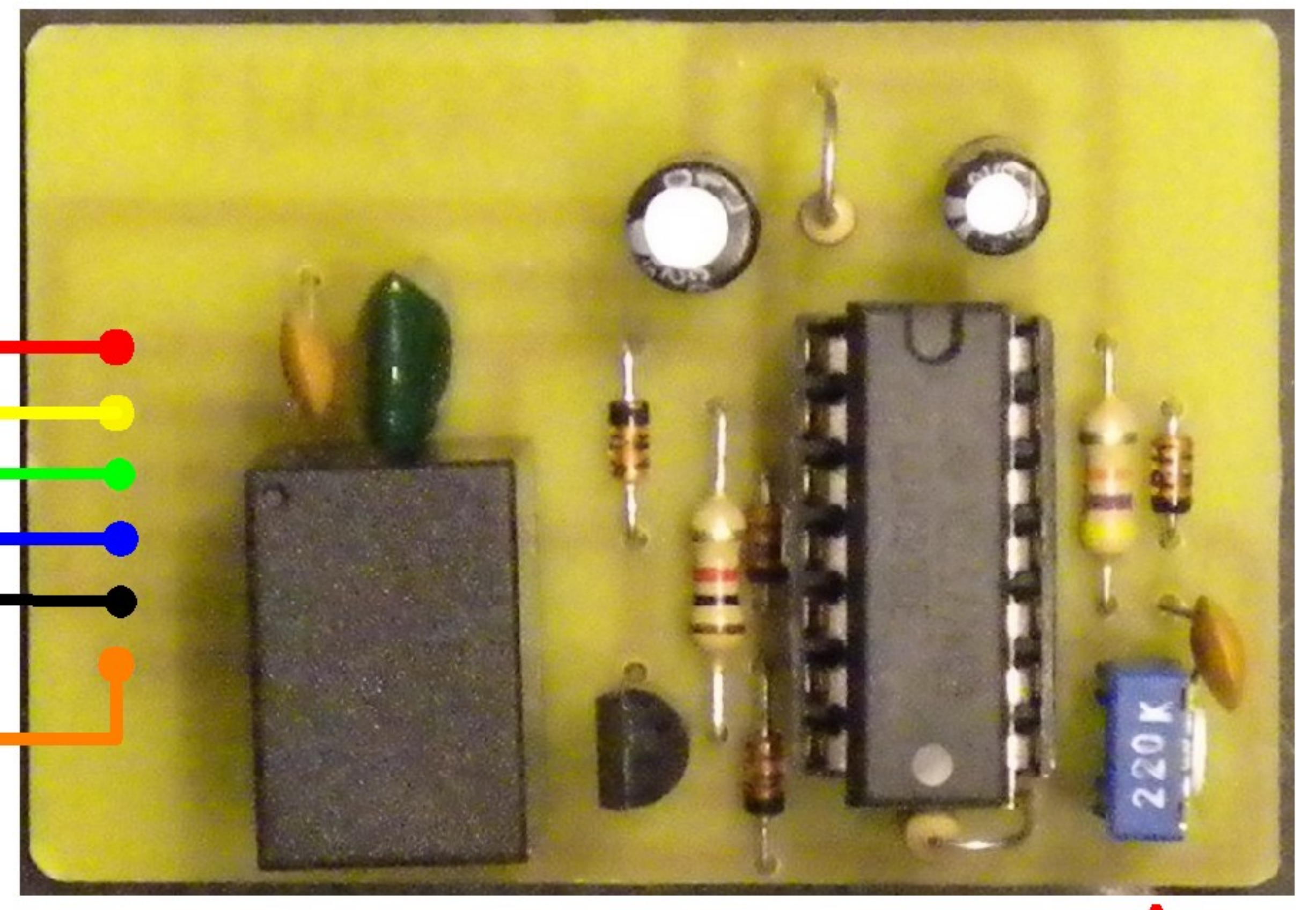
TRIMMER REGOLAZIONE TONO

PER CHI INSTALLA ANCHE I 120 CANALI (FK5) SI CONSIGLIA DI SALDARE LA BASETTA 120 CH (FK5) MASSA-MASSA CON IL TELAIETTO CHE RAFFREDDA IL PILOTA ED IL FINALE RF E DI FISSARE LA FK6 NEL FORO DOVE ERA PRIMA LA FK5